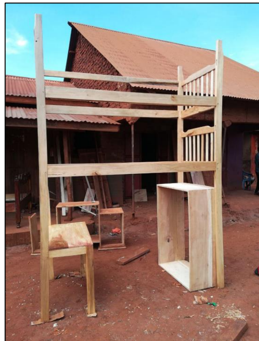
Hochbett bei Fertigstellung