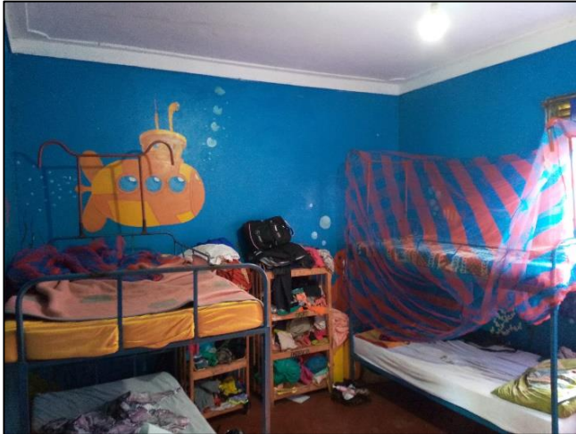
Hochbetten im Kinderzimmer

Auf den folgenden Bildern ist der Ist-Zustand zu sehen. Es gibt normale Hochbetten und in machen Räumen fehlen noch die Decken. Dadurch staut sich die Wärme in den Zimmern und die malariaübertragenden Moskitos können leicht in den Raum gelangen. Außerdem herrscht durch fehlende Schränke eine ziemliche Unordnung. Des Weiteren ist es in einigen Zimmern nötig, die Wände zu streichen.